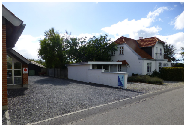
Bøvling Fri- og Efterskole

Men skolerne er interesserede i at indgå i et tættere samarbejde omkring etablering af motions- og aktivitetsstien – både for så vidt angår planlægning og for så vidt angår gennemførelsen. Hvis