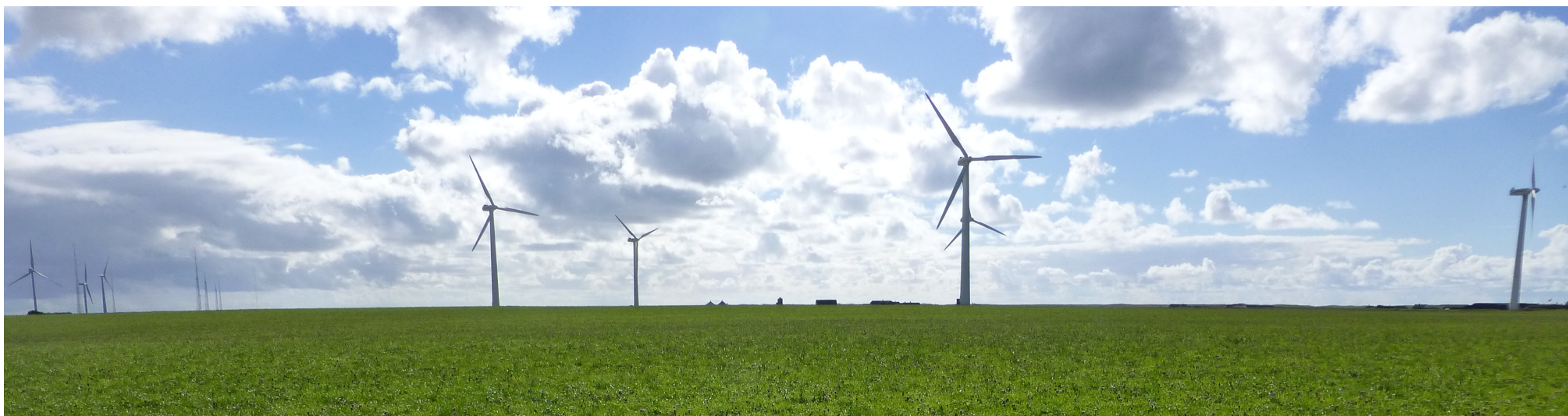
Vindmøller nordvest for Bøvlingbjerg