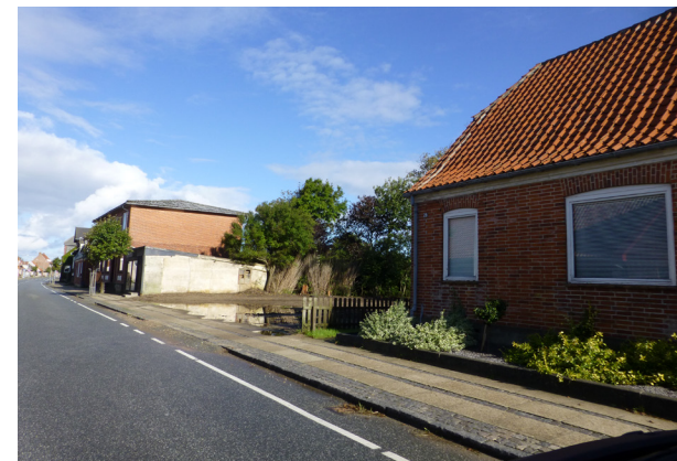
Et "hul i husrækken" på Tangsøgade

Det kan bl.a. ske med plantning af træer og/eller hække samtidigt med at pladsen bagved kan optage bilerne, der dermed fjernes fra cykelbanen.