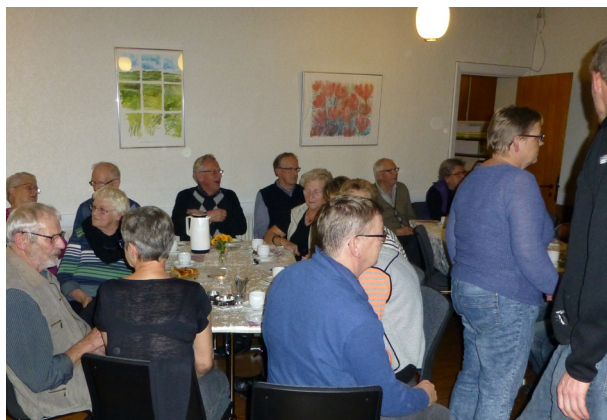
Fra borgermøde i november 2013

Som led i gennemførelsen vil der efter behov kunne etableres arbejdsgrupper og udvalg i relation til de enkelte delprojekter, og der vil blive etableret en følgegruppe med repræsentanter fra foreninger, borgere, institutioner m.v., der løbende kan fungere som kontakttled for sekretariatet. Se diagrammet og se i øvrigt side 7 om Borgerinddragelsen.