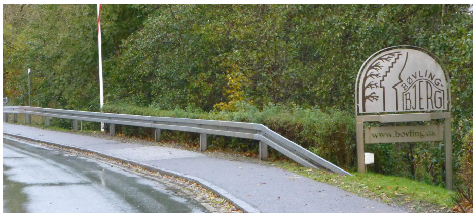
Velkommen til Bøvlingbjerg

bløde trafikanter i bymidten/Tangsøgade, at give byen et socialt og kulturelt løft ved at indrette et uformelt møde- og samlingssted i den gamle aula gerne kombineret med andre og nye aktiviteter i aulaen, og at inddrage den omkringliggende natur som et element i byens udvikling ved at etablere et sammenhængende stisystem fra Lergravsparken i nordøst til Put- & Take-søen i sydvest med en række spændende motions- og aktivitetspunkter undervejs.