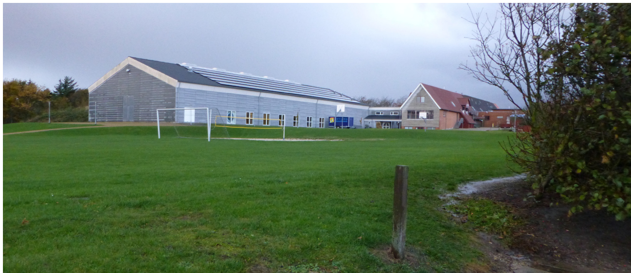
Bøvling Idrætsefterskole set fra boldbanerne

Aktivitetssti skal være en natur- og motionssti, men den skal også være et hyggeligt og uformelt mødested under åben himmel.