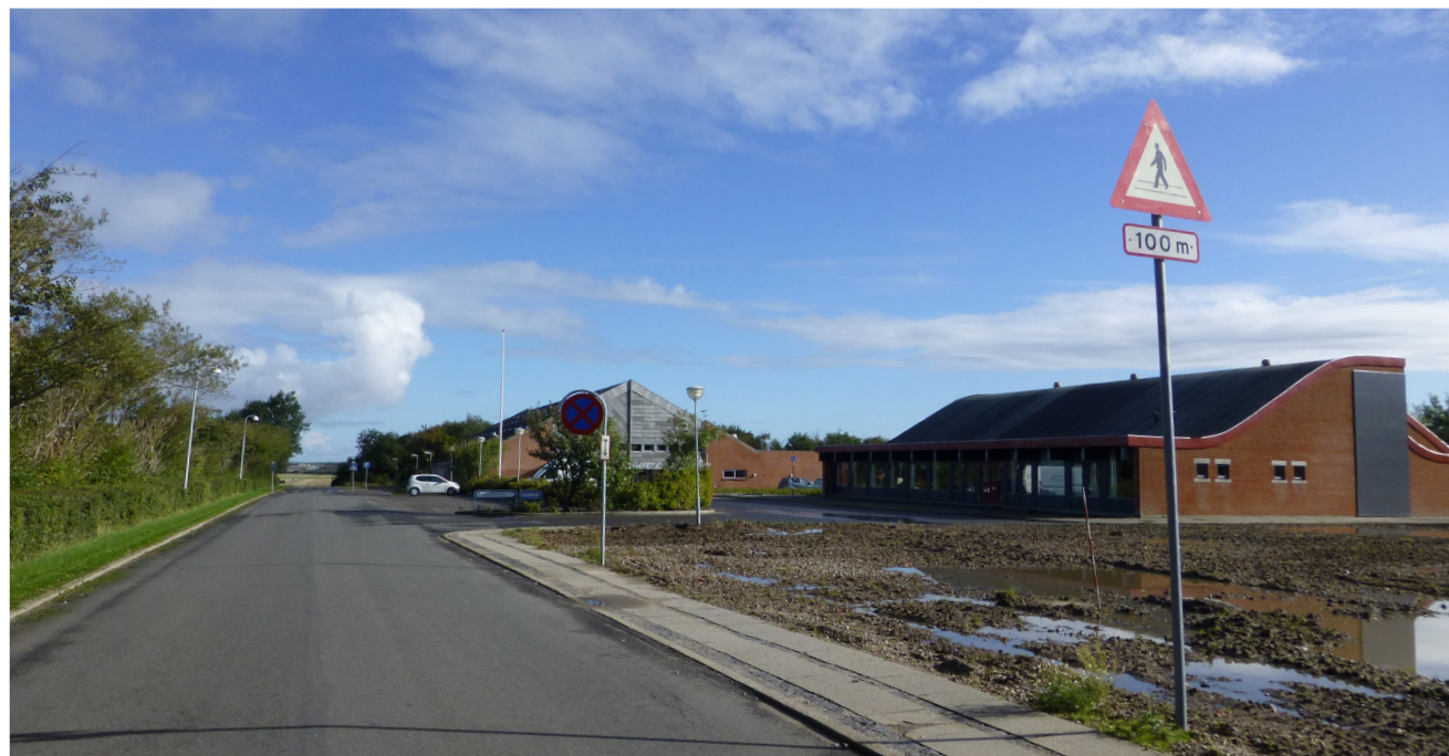
Tomten efter den nedrevne Bøvling Skole

alternativt sted skal understøttes. Men det afsatte beløb er ikke tilstrækkeligt til den fulde etablering, hvorfor yderligere finansieringskilder vil skulle i brug. Ligeledes vil selve aktivitetsindholdet i aulaen skulle planlægges nærmere som led i gennemførelsen.