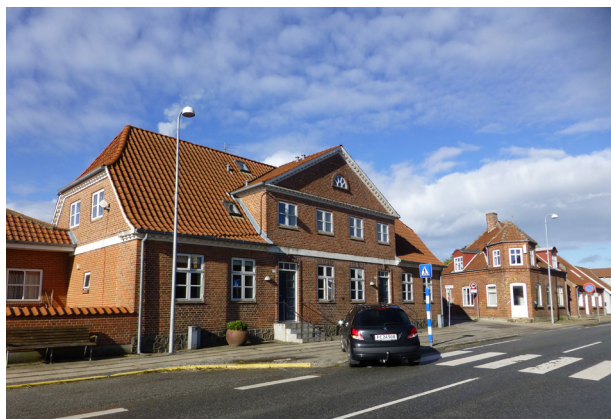
Det tidligere Hotel Bøvlingbjerg - nu almene boliger