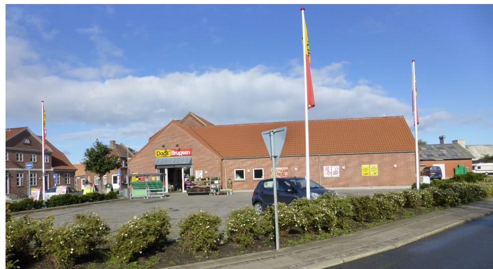
Parkeringspladsen ved Dagli' Brugsen set fra Kærvej