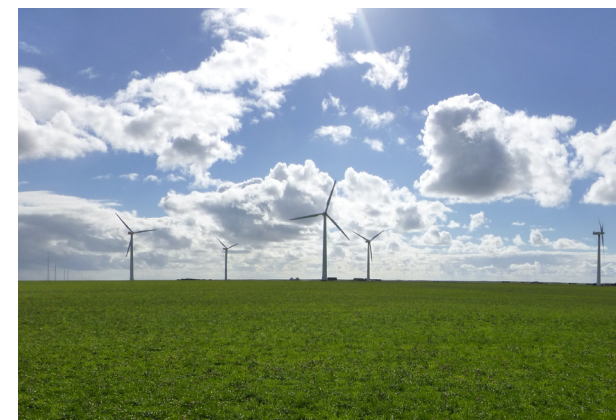
Vindmøller ved Bøvlingbjerg