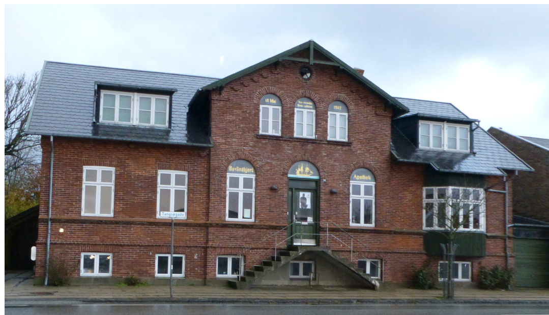
Tangsøgade 38, det tidligere Apotek