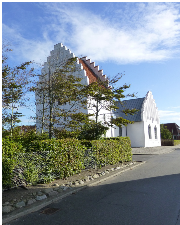
Marie Kirken i Bøvlingbjerg

Bøvlingbjerg, der har 554 indbyggere, er i kommuneplanen udpeget som et ud af syv lokalcentre i Lemvig Kommune. Byen ligger i kommunens sydvestlige del ca. midtvejs mellem Bækmarksbro og Nissum Fjord og Vesterhavet. Bøvlingbjerg fungerer som nærcenter i lokalområdet med hensyn til funktioner, der kan dække befolkningens daglige behov, herunder til dels den daglige service og kollektive trafik.