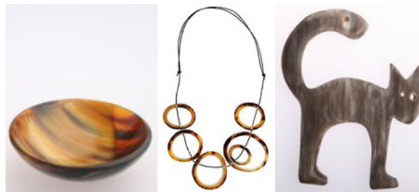
Eksempler fra Hornvarefabrikkens spændende udvalg

1. Egne butikker, hvor turisme og autentiske oplevelser er i højsædet. Målet er at give kunderne en oplevelse, hvor de oplever flowet fra råhorn til