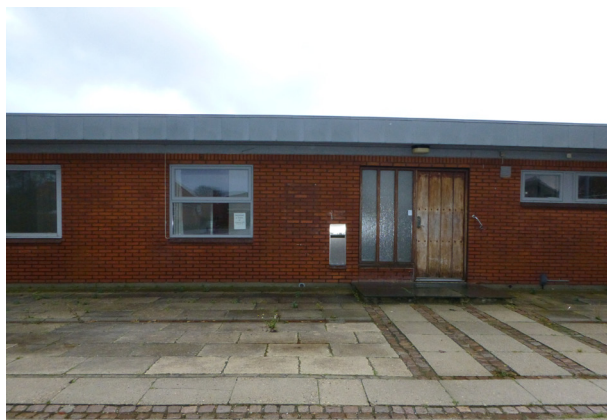
Tidligere lægeklinik - står nu tom