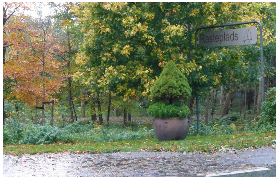
Rastepladsen syd for Anlægget

Tilsvarende gælder ønsket om at få rastepladsen syd for Fåre Mølleå ved Tangsøgade genopfrisket, herunder den mindre og noget forfaldne friluftscene. Det er oplagt et projekt, der kan styrke muligheden for at såvel fastboende som turister kan "komme ud i naturen", at rastepladsen kan ses fra Tangsøgade, er indbydende og giver en selvfølgelig mulighed for at parkere bilen, tage en pause på pladsen eller gå en tur i Anlægget eller det kommende naturområde syd for Bøvling.