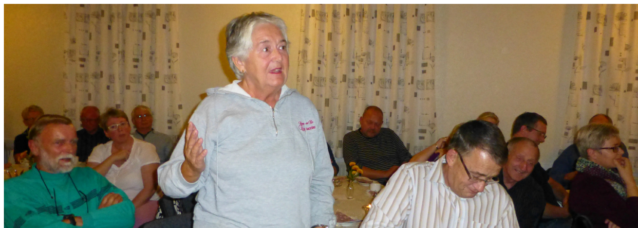
Et velbesøgt borgermøde i november 2013

Det er ikke ønsket, at der skal være omfattende borgerinddragelse ved hvert enkelt delprojekt men efter udarbejdelse af detailprojekter fra professionelle rådgiveres side, vil der blive foretaget en målrettet interessentinddragelse og en afsluttende høring før fysisk igangsætning.