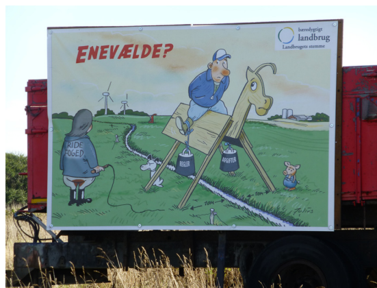
En sjov kommentar fra landbruget

Projektgruppen Bøvling 2020 og andre ildsjæle i Bøvlingbjerg arbejder løbende på at tilvejebringe yderligere midler til gennemførelse af forbedringer mv. i hele byen og omegnen. Se nærmere omtale heraf under investeringsredegørelsen.