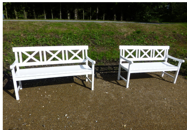
Måske et hvil på bænken i Anlægget?