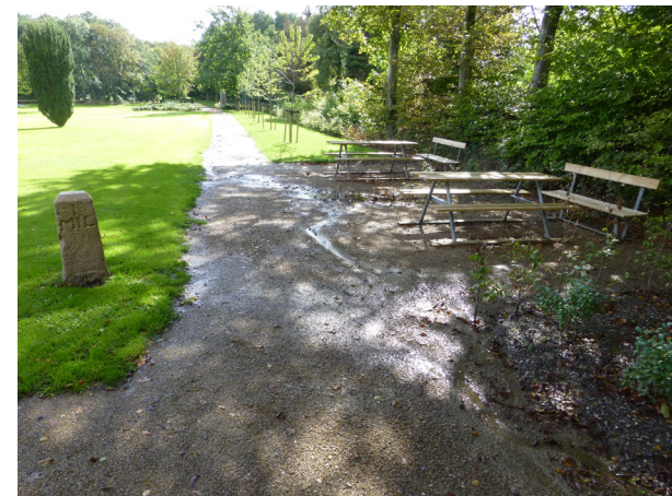
Bord-/bænkesæt i Anlægget

I dag står Anlægget fuldt renoveret klar til at modtage turister og borgere fra byen, og de fremtidige investeringer i Anlægget er derfor begrænsede, men det skal dog bemærkes, at den i områdefornyelsen højt prioriterede aktivitets- og motionssti forventes at skulle gå igennem dele af Anlægget for også på den måde at binde de vigtige "steder" i byen bedre sammen.