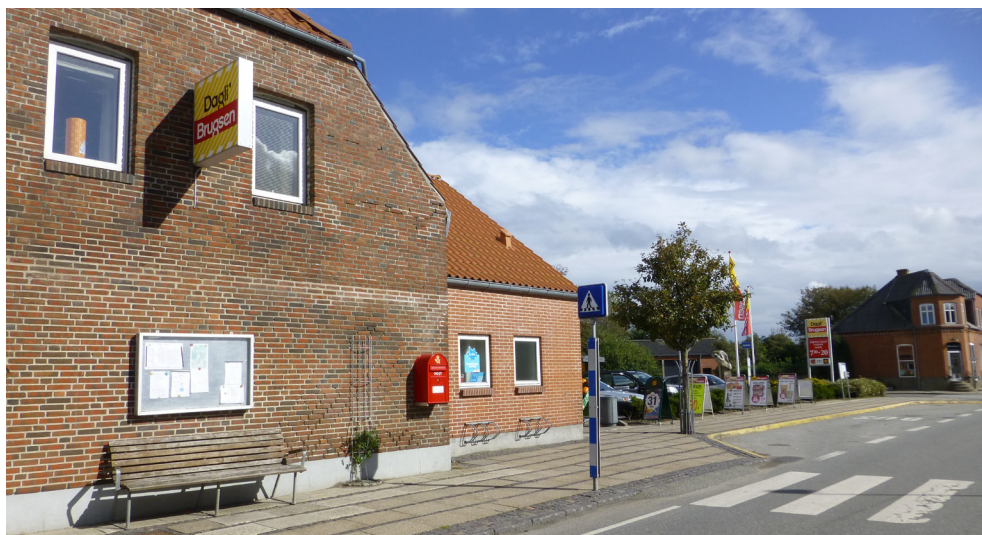
Dagli' Brugsen set fra Tangsøgade mod parkeringspladsen

Når tilsagnet er på plads, vil der skulle indgås aftale med en landskabsarkitekt, så et forprojekt kan udarbejdes, og således at udformning af torvet sker koordineret med cykelstierne (se 3.1).