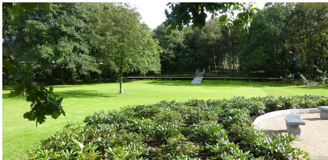
Det nyrenoverede Anlæg