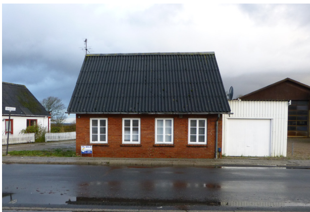
Hus til salg på Kærvej

I starten af gennemførelsesperioden ønskes afholdt et informationsmøde om mulighederne for istandsættelse af såvel bevaringsværdige som "almindelige" ejendomme i byen. Kommunens politik for støtte til gennemførelse af bygningsfornyelse vil blive nærmere fastlagt, og der vil på informationsmødet blive orienteret nærmere herom.