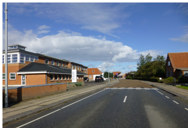
Vestjysk Smede, Tangsøgade 55

Dagli ´ Brugsen har selv planer om at udvide med en form for overdækning ud mod p-pladsen for at skabe et bedre miljø for både kunder og varer, og