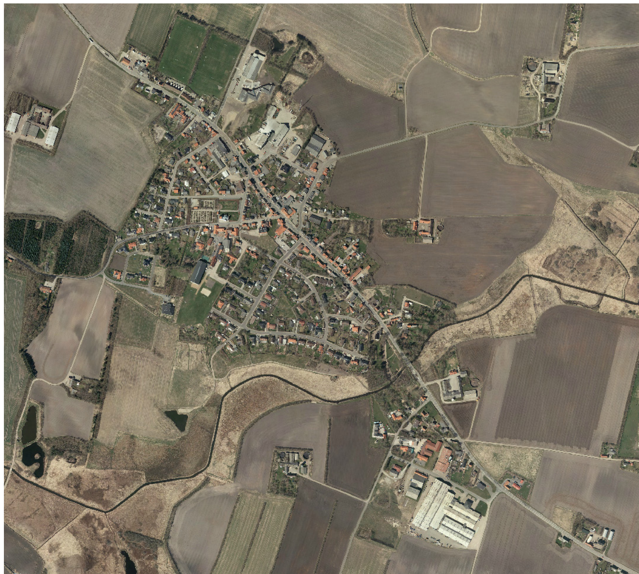
Luftfoto af Bøvlingbjerg

Der er allerede gennemført – eller ved at blive gennemført - områdefornyelsesprojekter i Lemvig, Thyborøn og Harbøre, Bækmarksbro og Nørre Nissum og turen er nu kommet til Bøvlingbjerg.