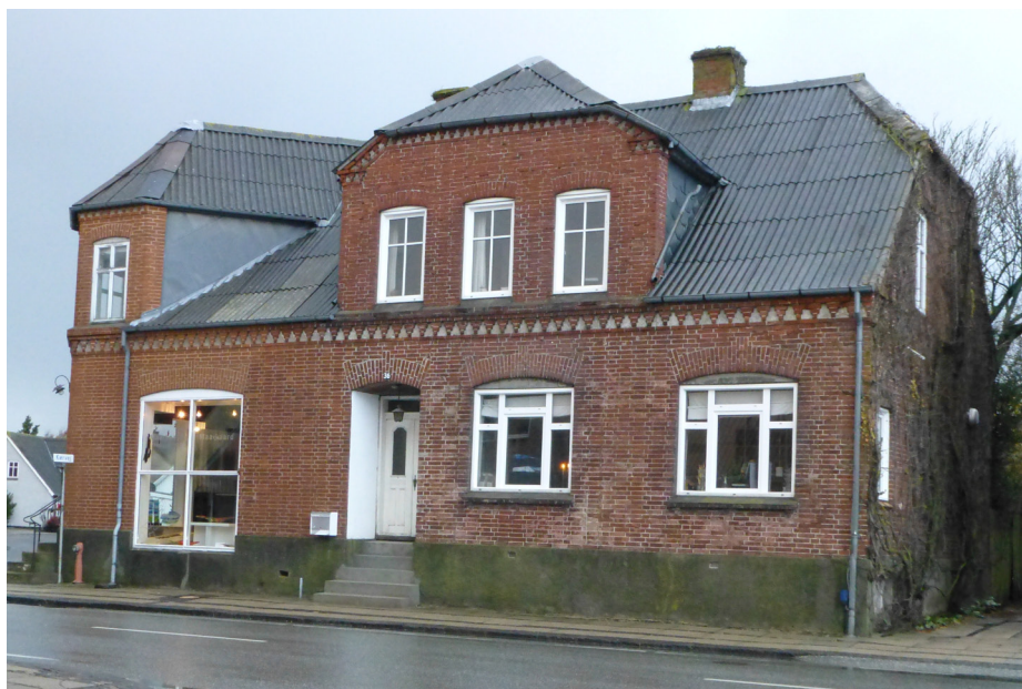
Tangsøgade 36 med bl.a. Maagaard Glasværk

puljen for 2015. Der er således mulighed for - med 60 % refusion fra staten - at kommunen kan indgå frivillige aftaler med bygningsejere om opkøb, istandsættelse, nedrivning og/eller oprydning.