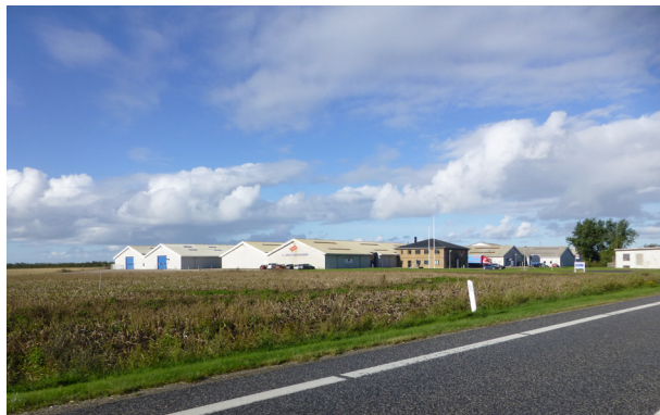
Erhvervsområdet syd for byen

Derudover kan nævnes: Jagtforening, karateklub, Bøvling Put and Take, Bøvling Billardklub, Bøvling Sangkor, FDF Bøvling, Bøvling Ungdoms- og Idrætsforening og Bøvling Sognehistorisk Forening og Arkiv.