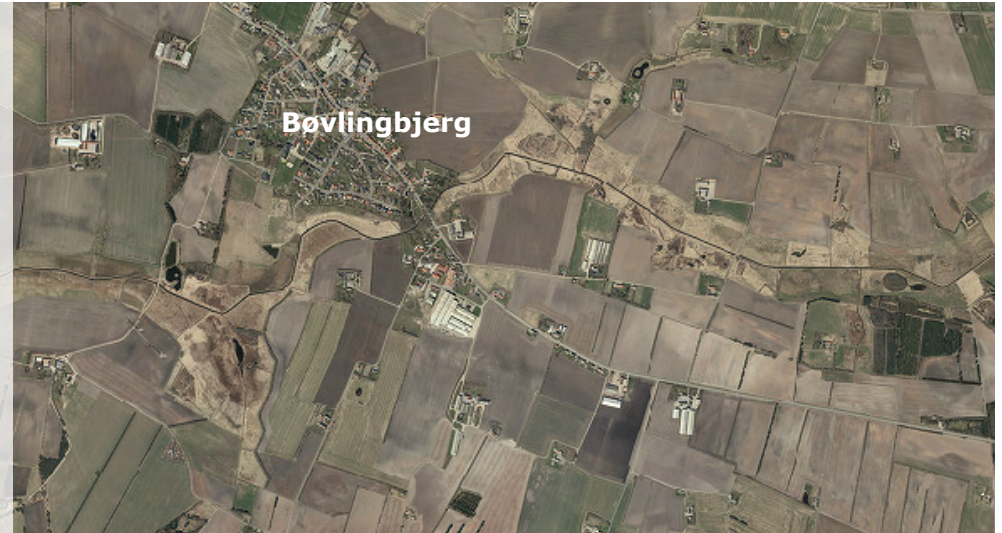
Bøvlingbjergs placering i forhold til Vesterhavet