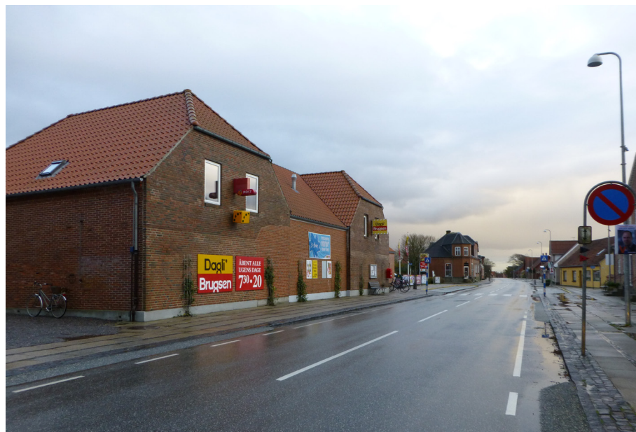
Tangsøgade og Dagli' Brugsen

Flere steder i Bøvling er der behov for mindre projekter med bedre skiltning af byens nuværende og kommende seværdigheder, ligesom der flere steder er behov for at plante træer og/eller hække, så bl.a. hovedvejen kan forskønnes og fremtræde mere grøn og levende.