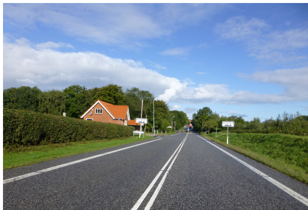
Indkørsel til Bøvlingbjerg fra syd

Man ønsker derfor indkørslerne markeret anderledes, så bilisten både føler sig velkommen i Bøvling og samtidig sætter hastigheden ned til maksimalt 50 km/t. Det overvejes bl.a. om en del af denne tilpasning kan være i form af en hævet flade omkring helleanlæggene.