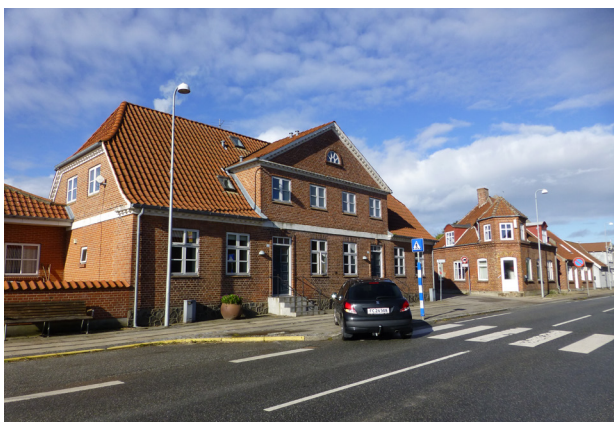
Parkeringsforhold på Tangsøgade og cykelsti udfordrer hinanden

Cykelstiernes etablering vil dog sandsynligvis også kræve en anden regulering af p-forholdene på Tangsøgade, se under 3.2