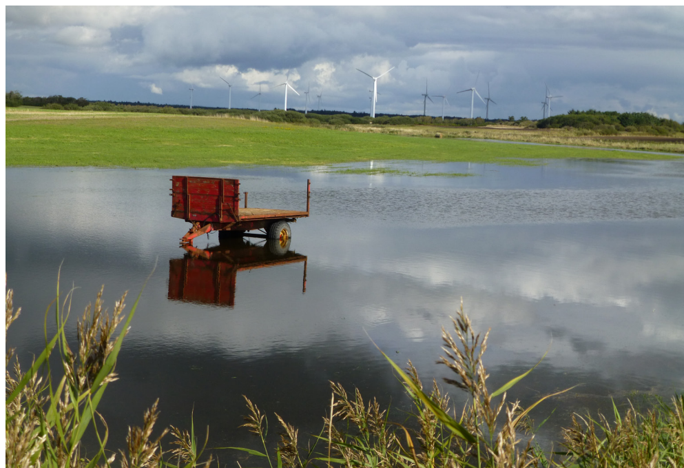
Vindmøllerne nord for Bøvlingbjerg

I Lemvig Kommune opstilles mange vindmøller, og den grønne ordning kan derfor medvirke til at finansiere nogle af de ønsker, som ikke er prioriteret til områdefornyelsen, eller som ikke har kunnet finansieres fuldt ud via områdefornyelsen. Det gælder f.eks.: