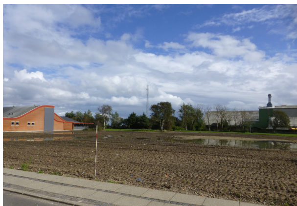
Hvad skal der ske her?

Se oversigt over de fleste af byens butikker, fabrikker, institutioner mv. på http://www.bovling.dk/Fagregister