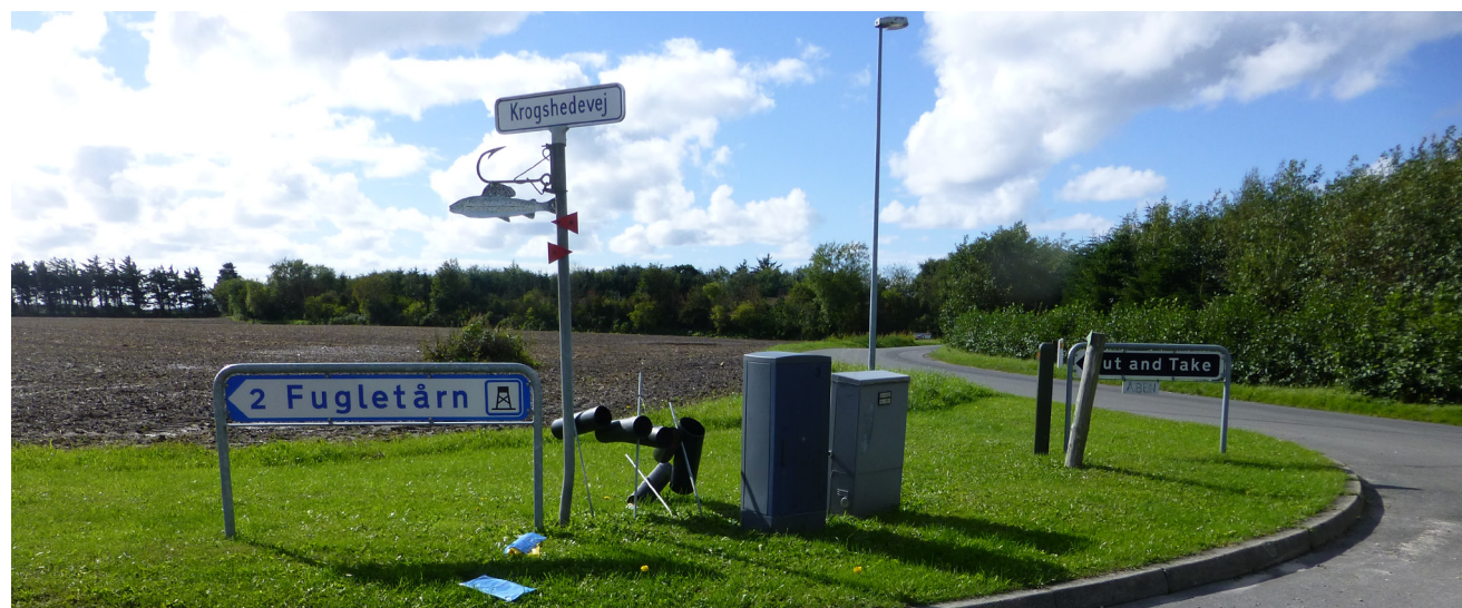
Høvsørevej møder Krogshedevej og Lillebjergvej

Om eller hvornår, der bliver mulighed for at gennemføre dette ønske, er der ikke truffet bestemmelse om endnu, men muligheden for projektet fastholdes.