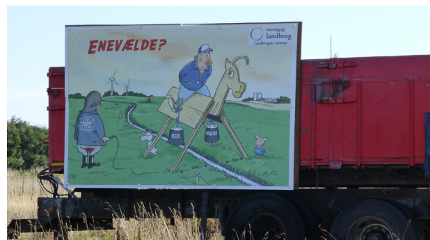
Bæredygtigt landbrug er med bag planerne om fødevarerklngen

Problemet for mange små producenter er, at de ikke har adgang til et godkendt køkken eller slagteri. Derved kan de ikke producere fødevarer, som kan blive solgt i detailhandlen eller direkte til forbrugere på lovlig vis.